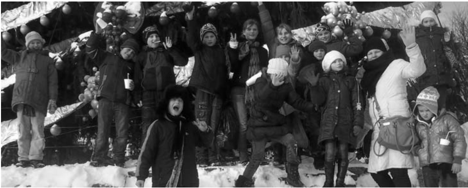
Attēlā: Bērsteles skolas skolēni „Lido” slidotavā Rīgā

Sniegotajā 14. decembra dienā, skolotājas Līgas Bajāres pavadībā, skolēnu grupiņa, izmantojot Rundāles mednieku biedrības dāvanu par dalību zīļu vākšanas konkursā - apmaksātu transportu, devās ekskursijā uz Rīgu.