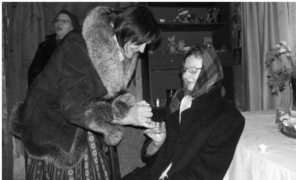
Attēlā: Decembrī folkloras kopa Svitene dalīb-nieki viesojās daudzās vientuļo pensionāru mājās, sveicot svētkos

Tradīcijas pirmsākumi meklējami 1992.gada Ziemassvētkos. Toreiz akcijas dalīb-nieki bija skolotāji Ilga Vaičūne,