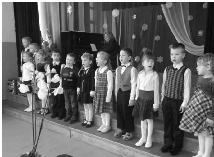
Attēlā: Ziemassvētku koncerts Svītenes skolā

Gunta Novika, Pilsrundāles vidusskolas struktūrvienības Svītenes skola vadītāja