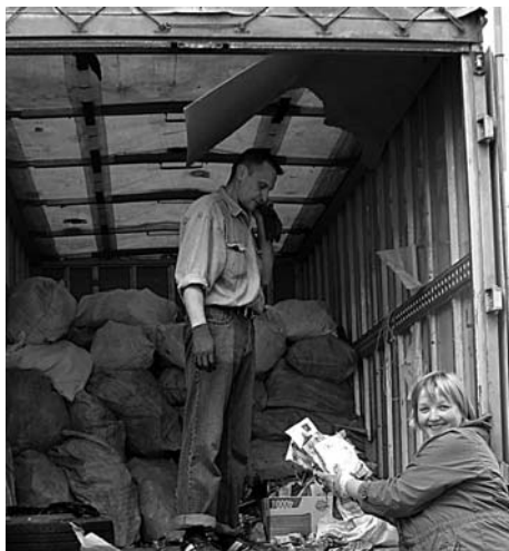
Attēlā: Pēdējās makulatūras kravas aizvešana no Pilsrundāles bibliotēkas

Mūsu novada Pilsrundāles, Bērsteles un Vecrundāles bibliotēkas piedalījās makulatūras vākšanas akcijā „Bibliotēka man, es bibliotēkai”, ne tikai atbalstot vietējo ražotāju un videi draudzīgu domāšanu un dzīvesveidu, bet arī cīnoties par bibliotēkām nodēriģām balvām. Akcijas iniciatori bija “Papīrfabrika „Līgatne”” un publisko