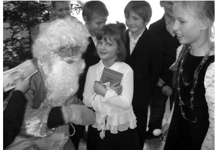
Attēlā: Ziemassvētku vecītis Bērsteles skolas skolēniem bija sagatavojis īpašas dāvanas